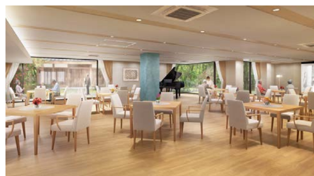
<1階 グランドダイニング>