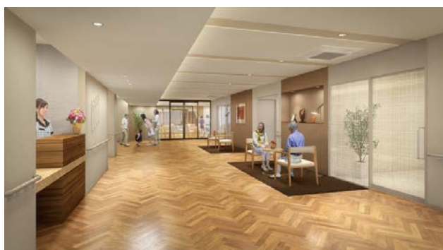
<1階 エントランスロビー>