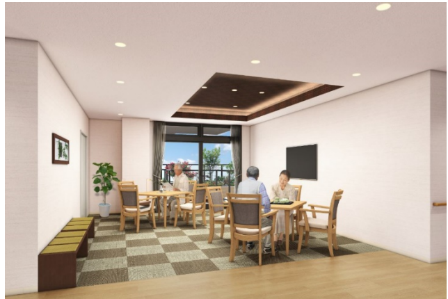
< リビング(談話スペース) >