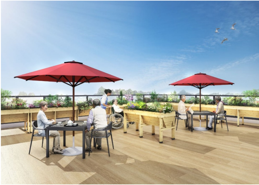
< ルーフバルコニー >