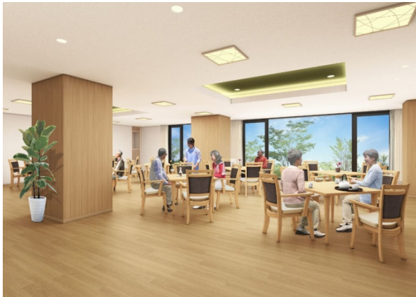
< ダイニング(食堂) >