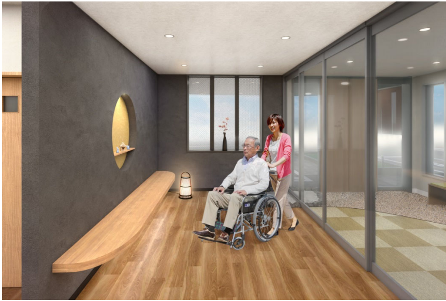
< エントランス >