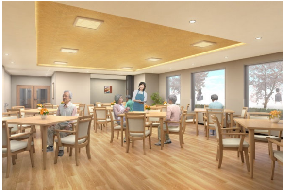
< ダイニング(食堂) >