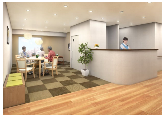
< リビング(談話スペース) >