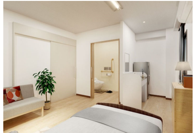
< 居室② >