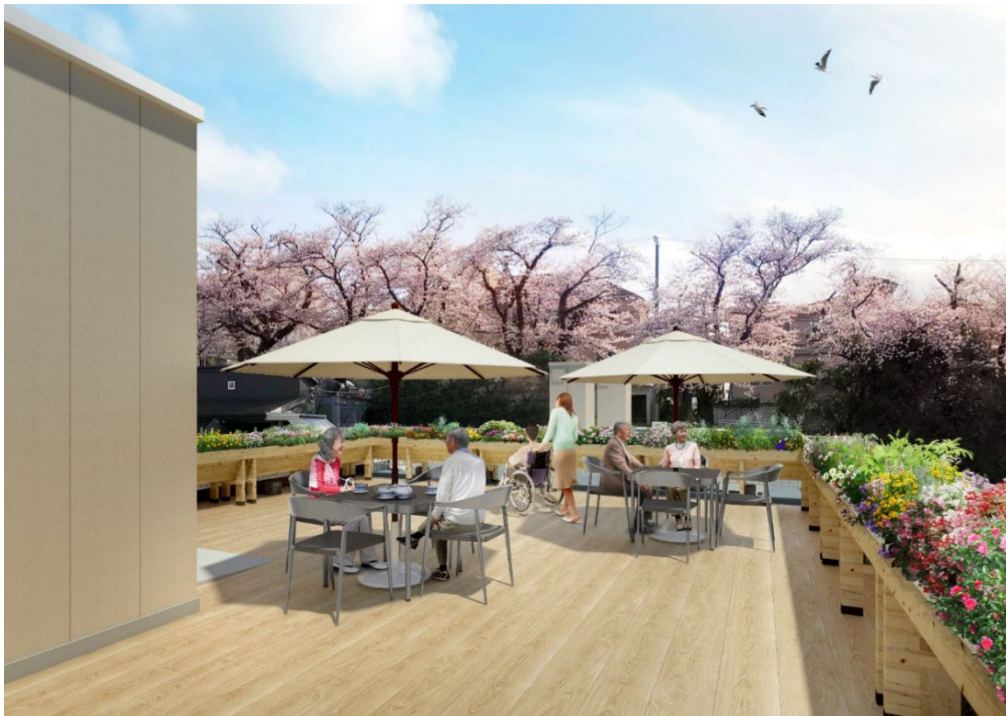
< ルーフバルコニー >