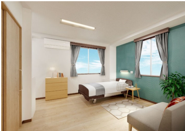
< 居室① >