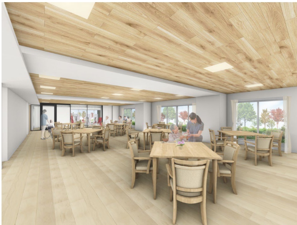
< ダイニング(食堂) >