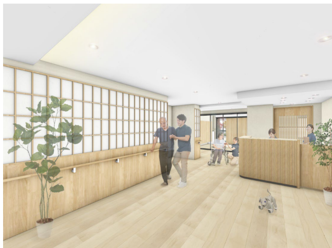
< エントランス >