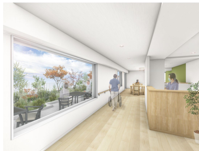
< 5階 リビング(談話スペース)・ルーフバルコニー >