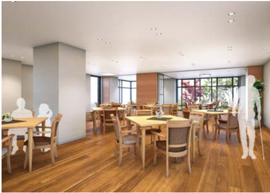
<グランドダイニング>