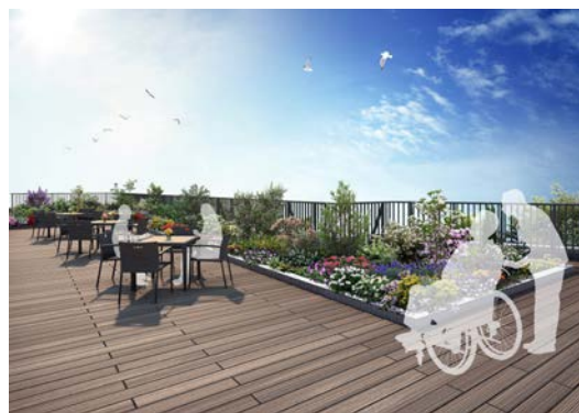
＜屋上 ガーデンテラス＞