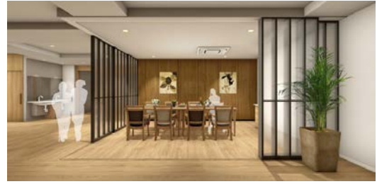
<ファミリールーム>