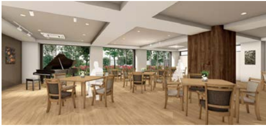
<グランドダイニング>