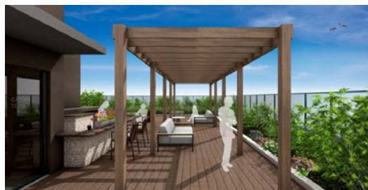
<屋上 ガーデンテラス>